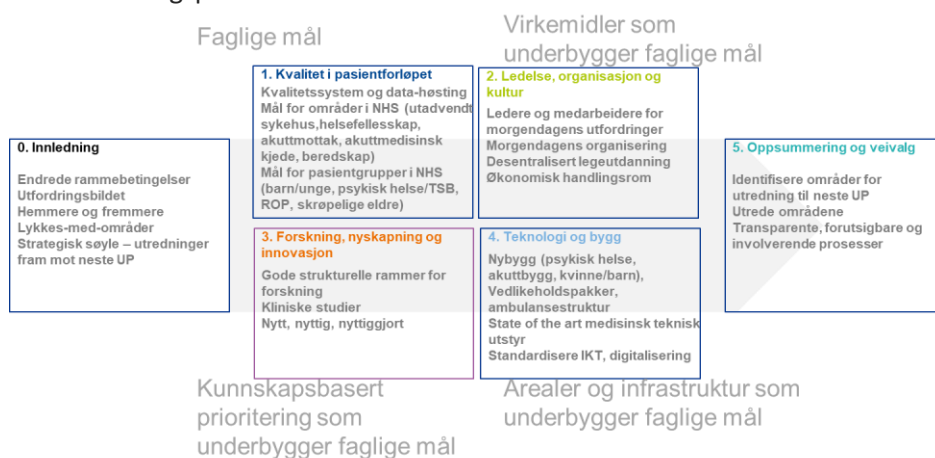
Figur 2: Kapitlenes struktur og funksjon

Høringsversjonen av Utviklingsplan 2040 består av fem kapitler, hvorav kapitlene 1-4 samsvarer med strukturen for strategi 2021-2024 (lenke). Innledningskapittelet (0) gjennomgår endrede rammebetingelser siden Utviklingsplan 2035. I kapittel 1, Kvalitet i pasientforløpet , beskrives målsetninger i tråd med veilederen. Disse er i stor grad knyttet til Nasjonal helse- og sykehusplan. Utviklingsplan 2035 inneholder faglige mål som også gjelder i et 2040-perspektiv. Kapitlene 2-4 beskriver virkemidler for å oppnå faglige mål. Godt lederskap og effektiv organisering av arbeidet blir enda viktigere i den kommende perioden (kapittel 2). Forskning er en av foretakets lovpålagte oppgaver, og SSHF skal benytte innovative, kunnskapsbaserte verktøy og kompetanse i utviklingen av sykehusene (kapittel 3). Sykehusene skal jobbe sammen med kommunene om hjemmeoppfølging av pasientene. Dette krever tilrettelagt teknologi og infrastruktur. Det vil samtidig være behov for nye bygg, vedlikeholdsmidler til eksisterende bygg, og moderne medisinsk teknisk utstyr (kapittel 4). I kapittel 5 sees endrede forutsetninger fra innledningskapittelet i lys av områdene i kapitlene 1-4. Veivalg beskrives, og det pekes på områder for vurdere utredning fram til neste utviklingsplan.