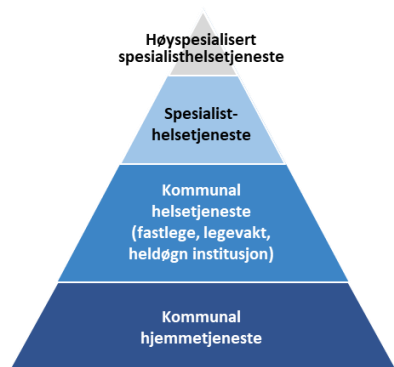
Figur 5: Helsepyramiden

Helsepyramiden illustrerer samhandling som et helsesystem, med Laveste Effektive Omsorgsnivå (LEON).